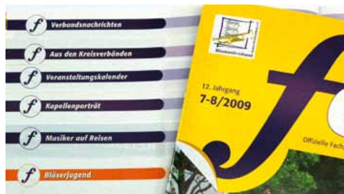
Wenn Sie die Tipps der Redaktion beachten, steht einer erfolgreichen Pressearbeit in der Verbandszeitschrift nichts mehr im Wege.